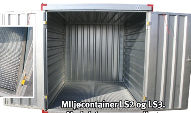
Miljøcontainer LS2 og LS3. Med rist og oppsamling.

Containerer til alle formål – For mer informasjon se www.gmm.no