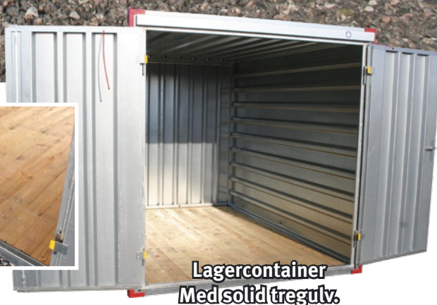
Lagercontainer Med solid tregulv.